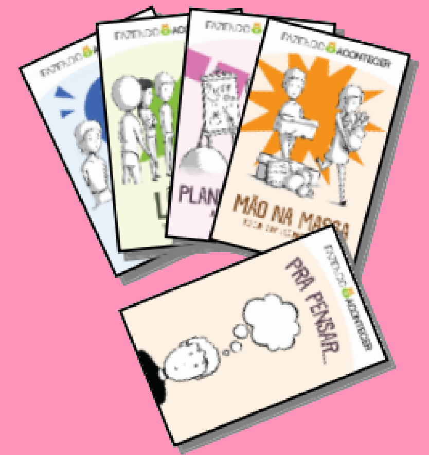
Cards (e/ou Botons)