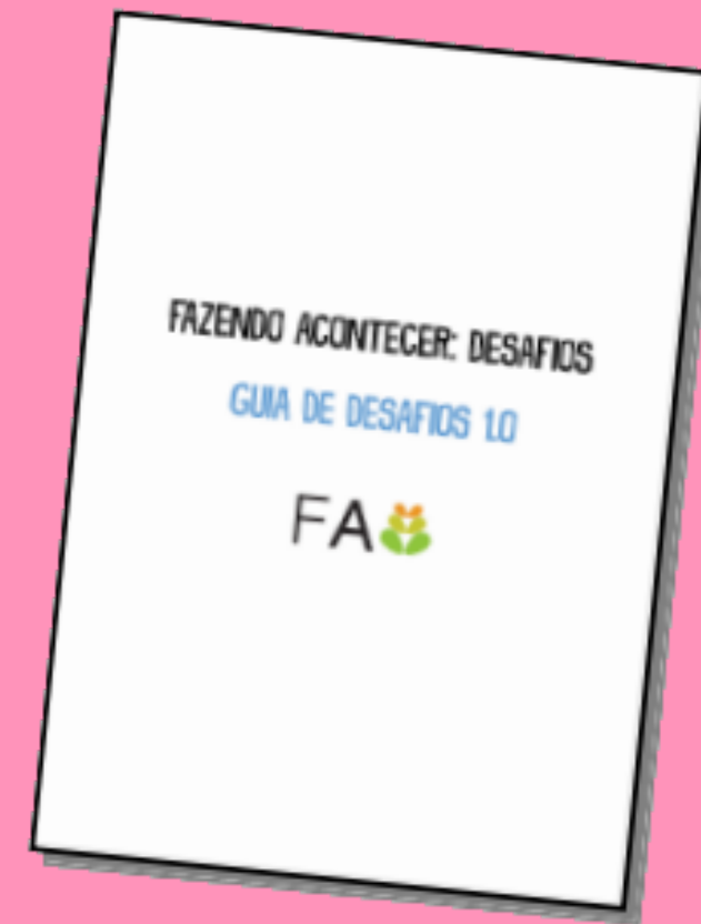
Guia dos Desafios