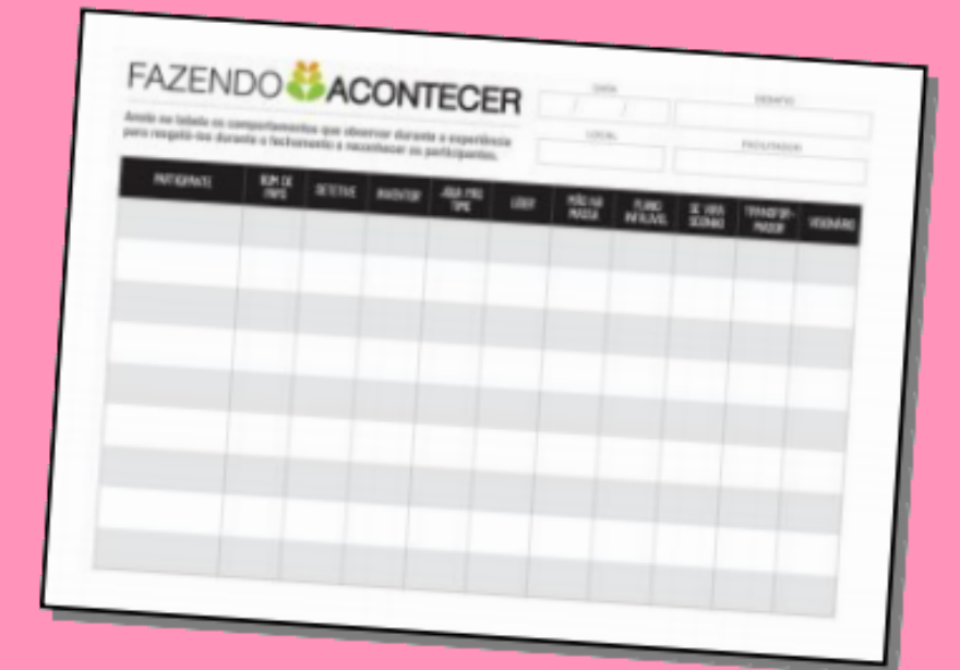
Ficha de Acompanhamento