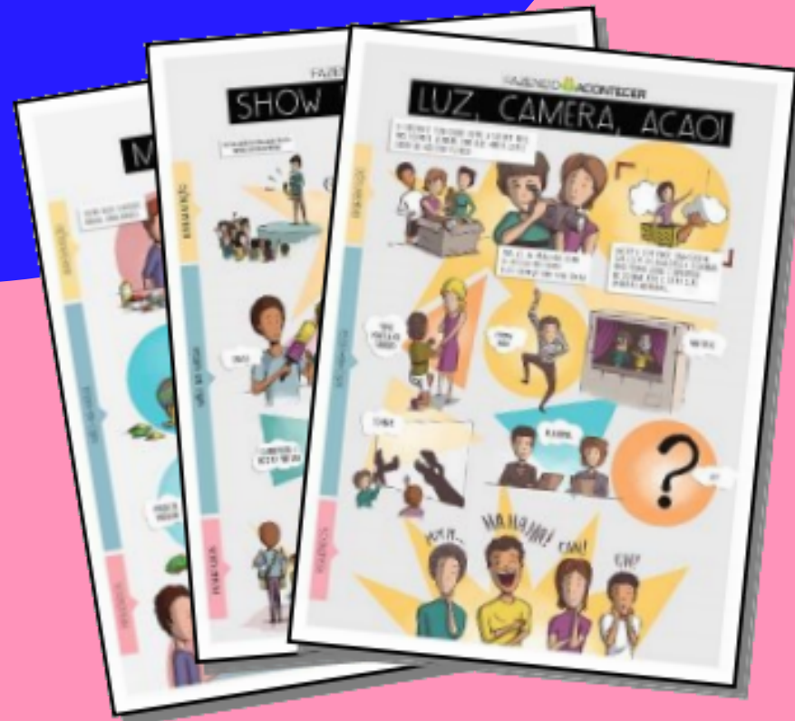
Guia dos Jogadores