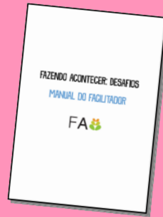
Manual do Facilitador